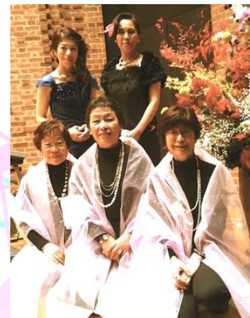
オカリナアンサンブル 花みずき