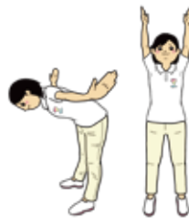
(身体を使ったマインドフルネスの例)