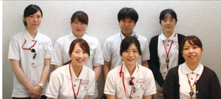
■ご利用者、病院、地域を結ぶ、支援窓口です。

などの利用者さまからのご相談を受け付けております。 その他、地域の病医院、施設等からの受診や転院等のご相談や調整窓口・虹のつどいなどの事務局・退院支援、地域生活支援を行っております。