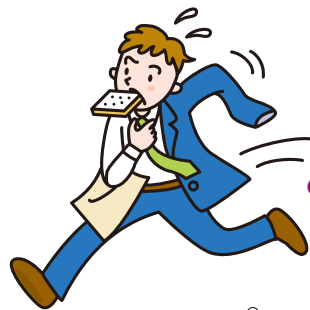
●朝の準備がスムーズにできず、遅刻する