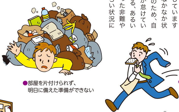
●部屋を片付けられず、明日に備えた準備ができない

大人になってからADHDと診断される人は、こうしたADHDの症状に子どもの頃からずっと悩まされています。多くの人は自分なりの工夫や対策を考えて努力していますが、それにもかかわらずなかなか状況が改善されません。そのため、自分自身を責めたり、本人が怠けている、悪気があってやっている、あるいは親の育て方のせいといった非難や誤解にさらされたり、つらい状況に置かれがちです。