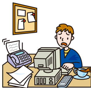
●仕事や家事の段取りができない