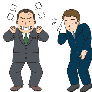
●忘れ物やうっかりしたミスが多く、周囲の人に迷惑をかける